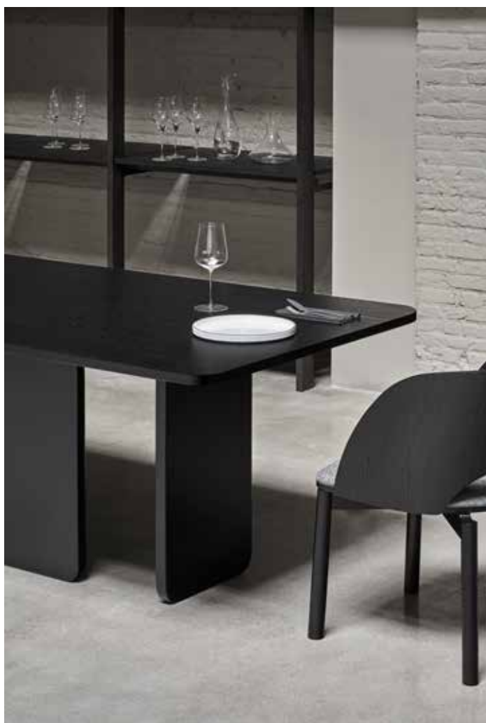
Arq - Mesa de salón