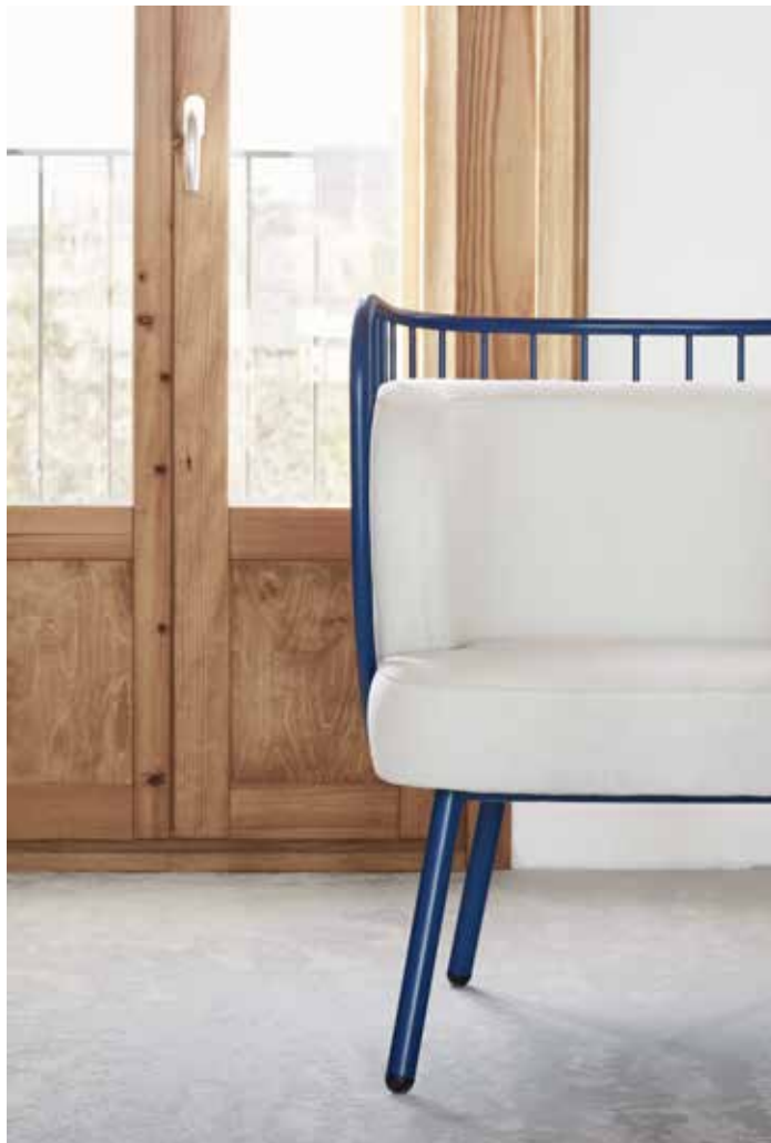
Nabi - Butaca