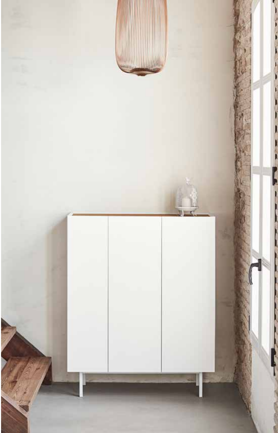
Cabinet 3D / Meuble auxiliaire 3P