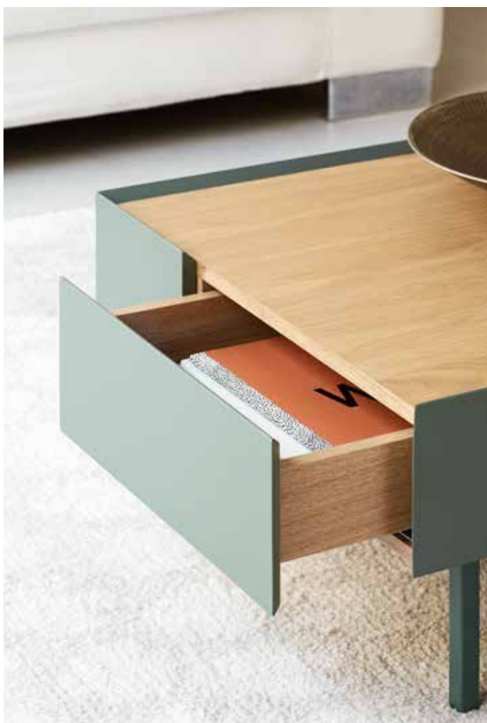
Arista - Mesa de centro 2C