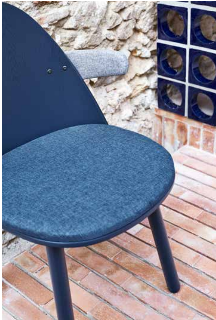
Uma - Silla