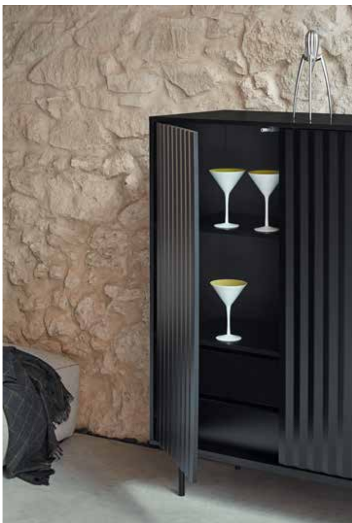
Sierra - Auxiliar 2P2C