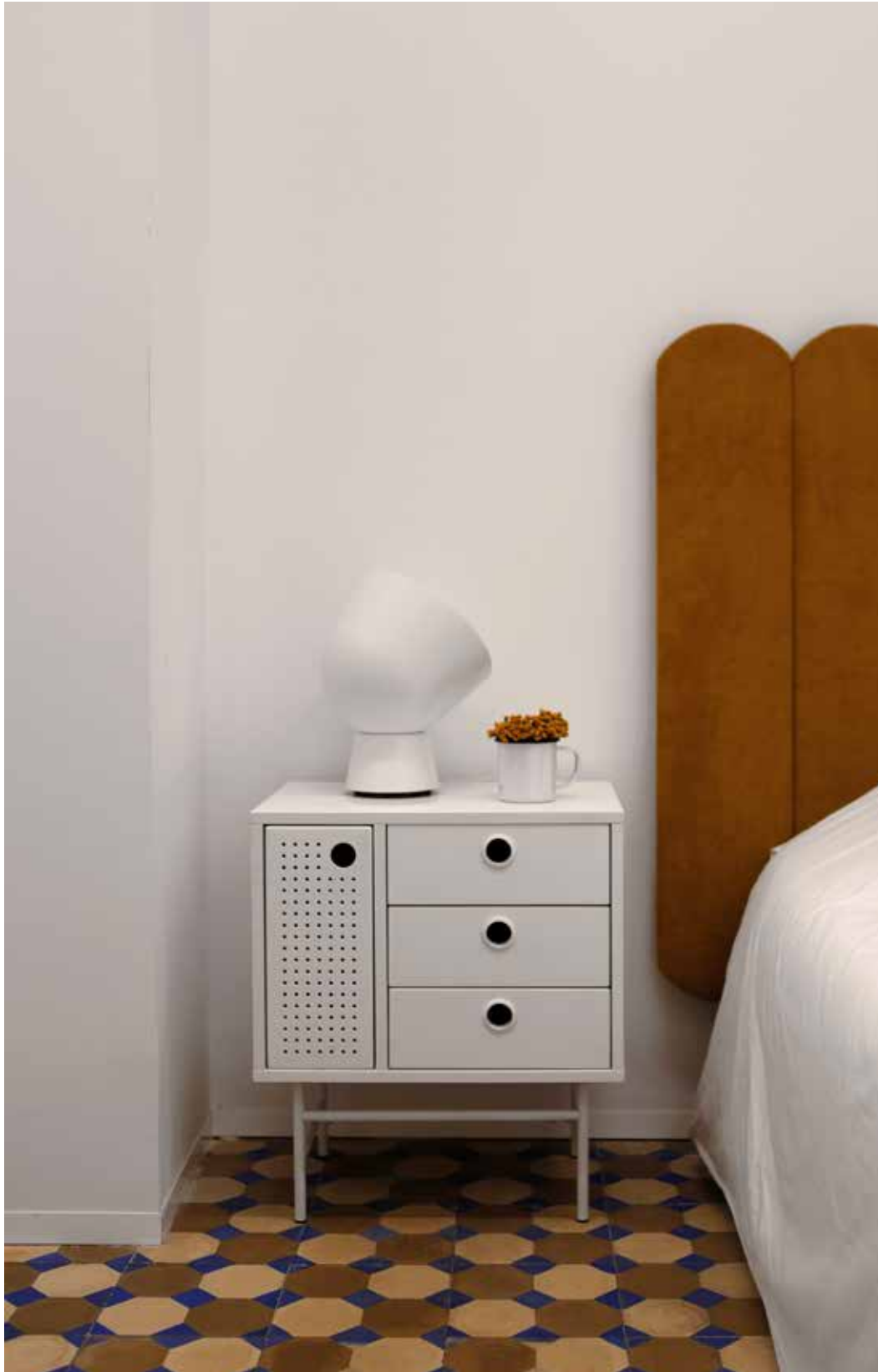
Bedside table 1D3Dr / Chevet 1P3T