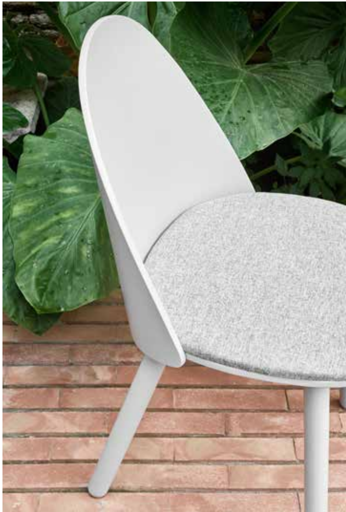
Uma - Silla