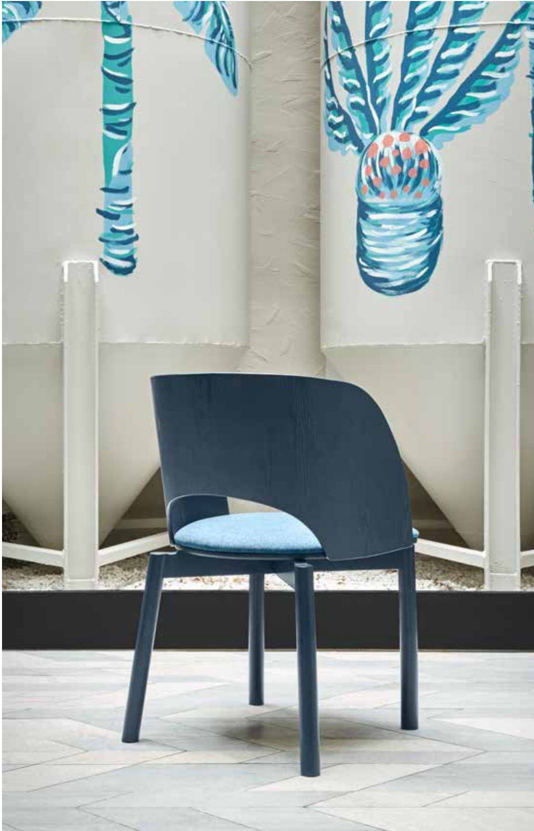
Chair / Chaise