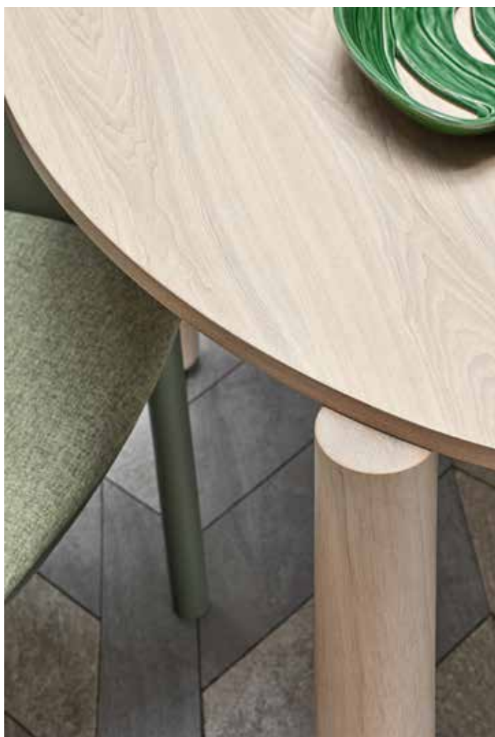
Dining table / Table de séjour