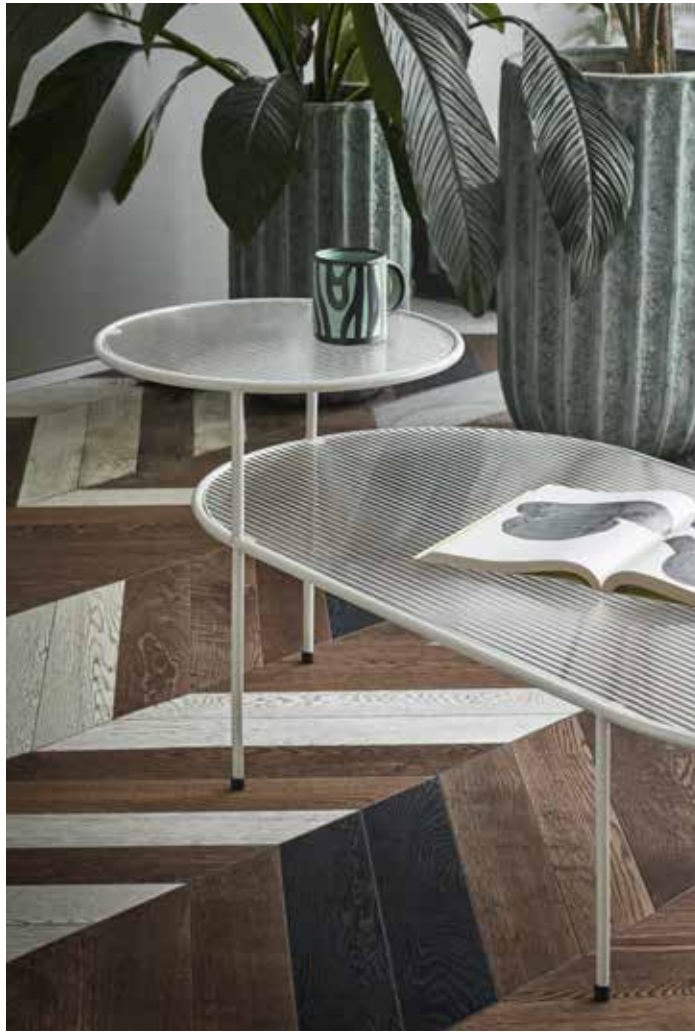
Coffee table / Table de salon