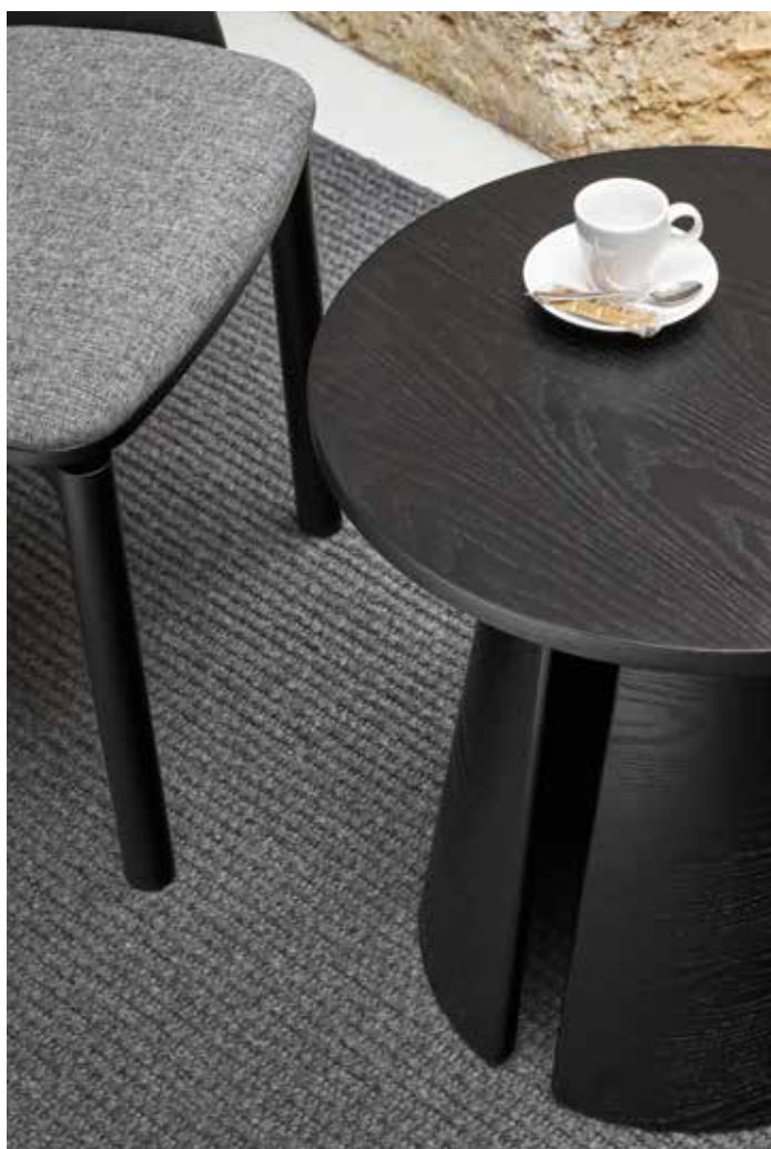
Side table / Table de coin