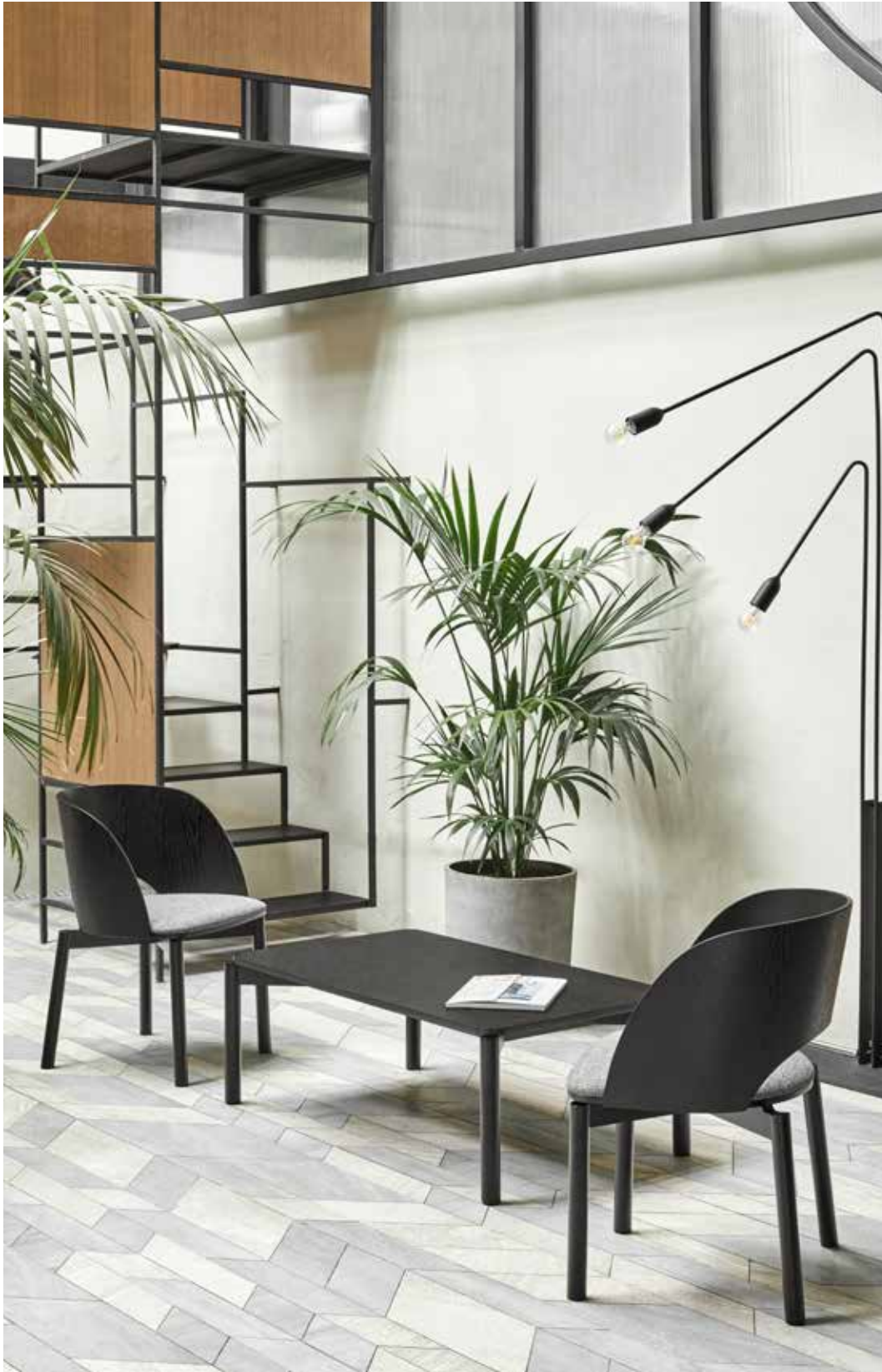
Coffee table / Table de salon