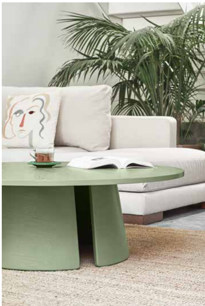
Coffee table / Table de salon