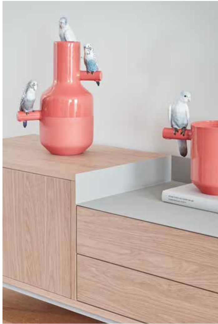
TV bench 3D2D1 / Mueble TV 3P2T