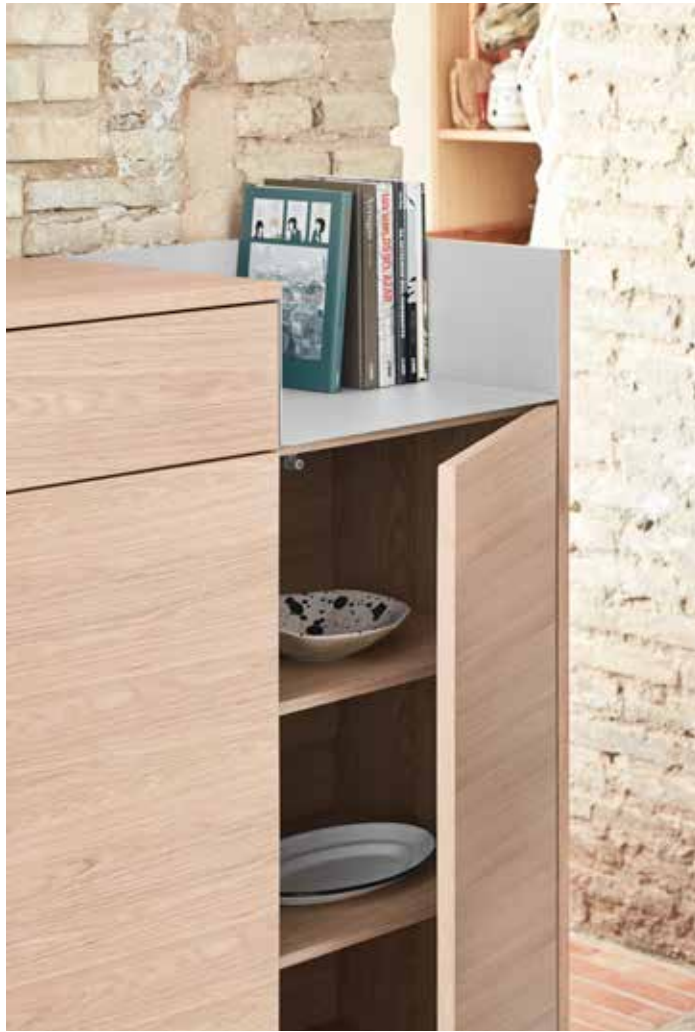
Cabinet 2D1Dr / Meuble auxiliaire 2P1T