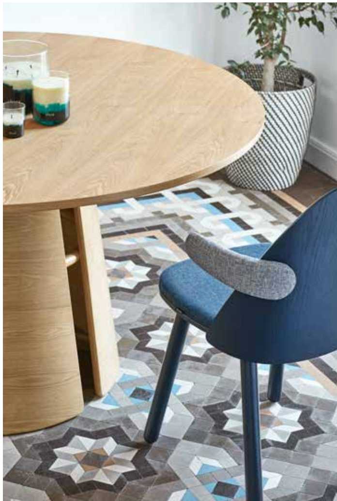
Cep - Mesa de salón