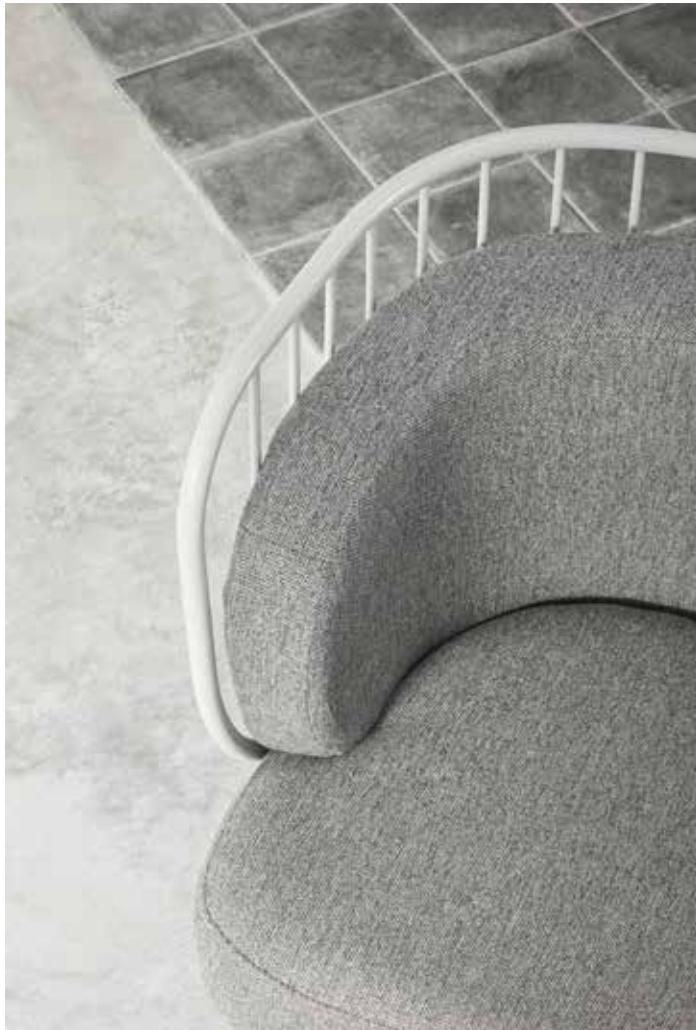
Nabi - Butaca