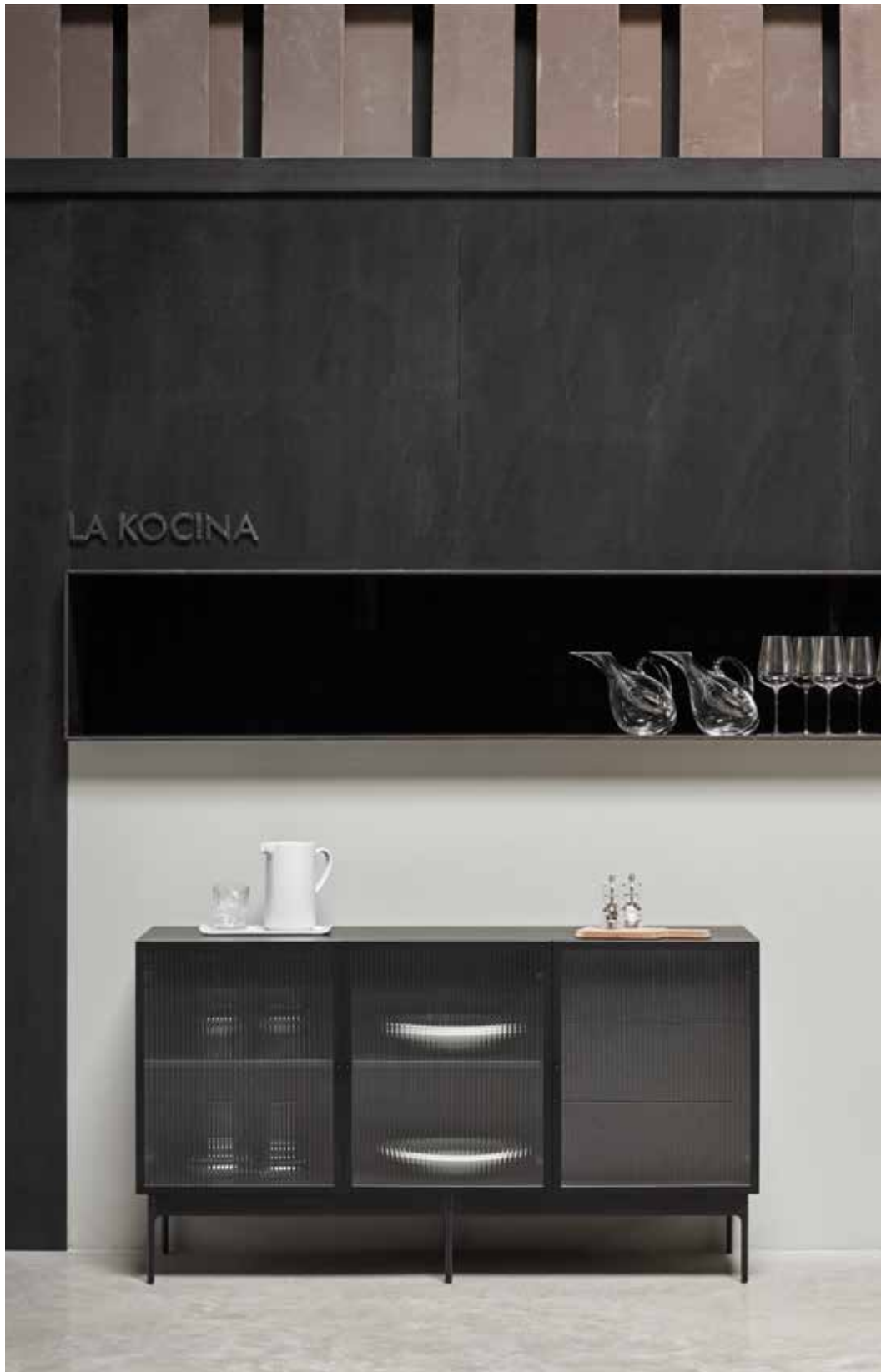
Blur - Aparador 3P3C