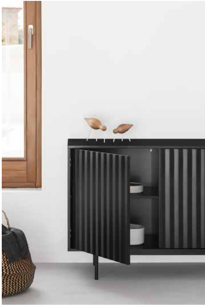
Sideboard 4D3Dr / Buffet 4P3T