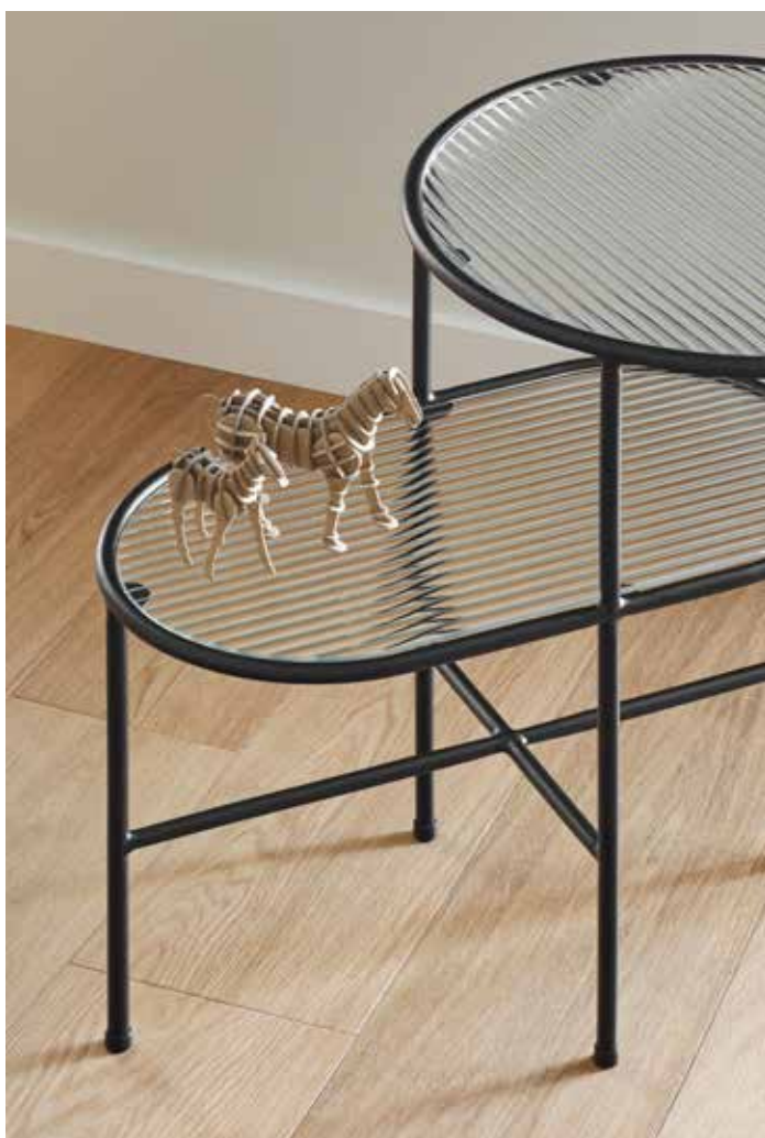
Nix - Mesa auxiliar