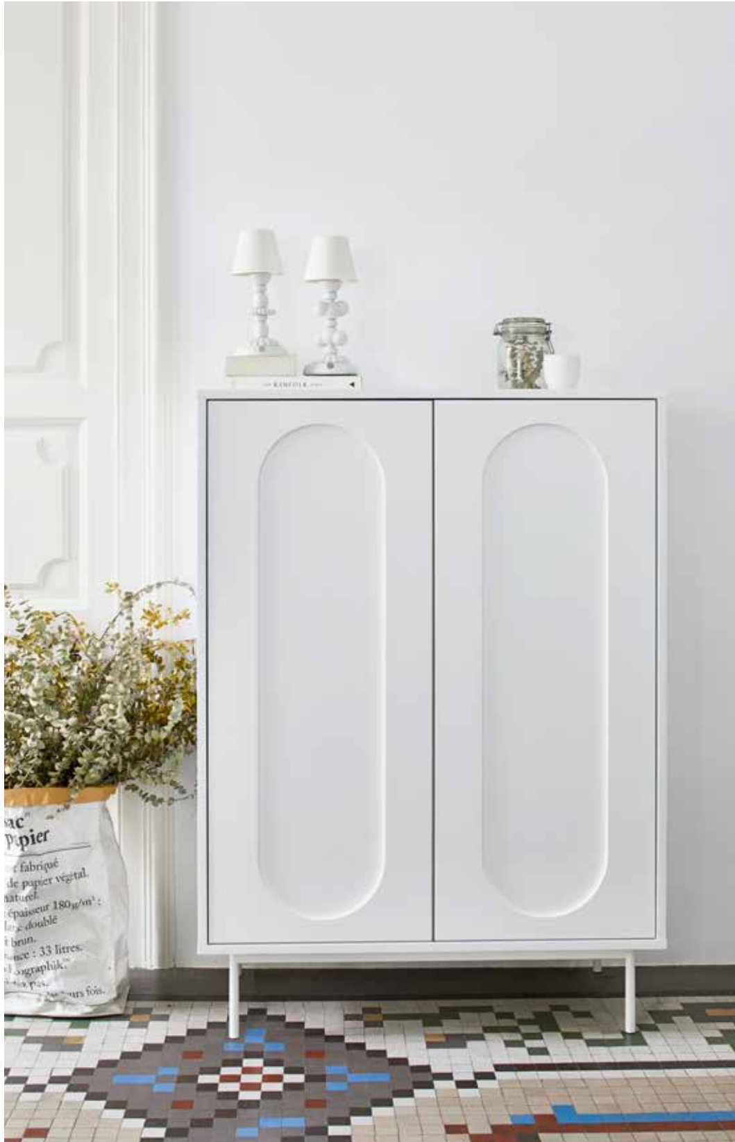
Orbita - Auxiliar 2P2C