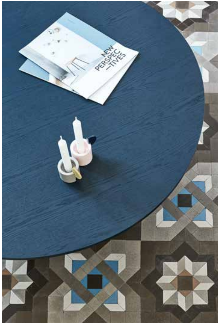
Cep - Mesa de centro