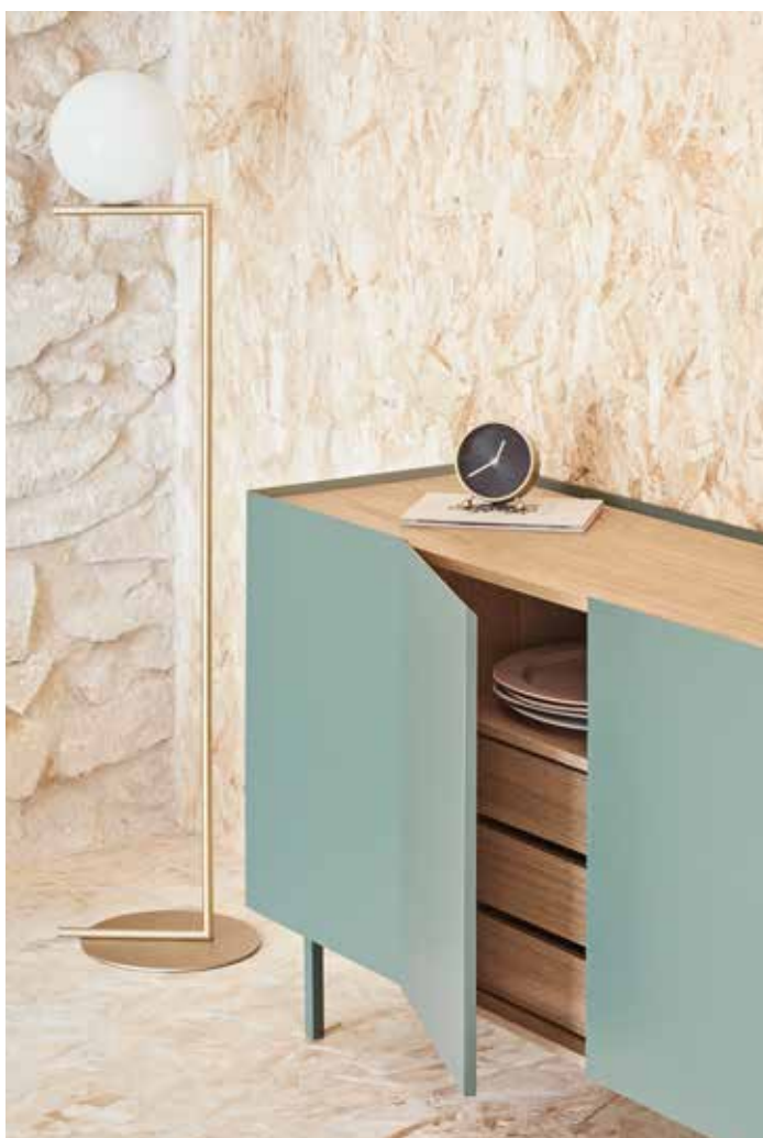
Arista - Aparador 4P3C