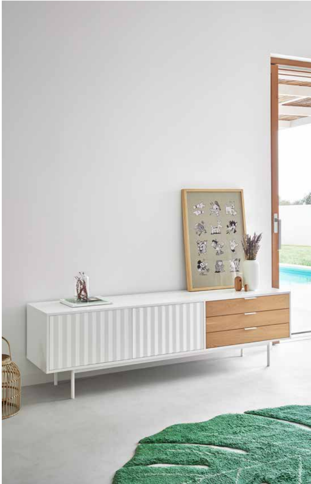
TV bench 2D3Dr / Meuble TV 2P3T