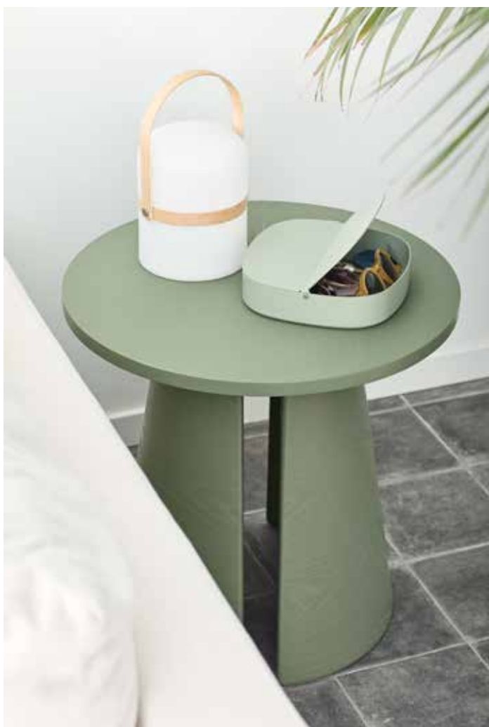
Cep - Mesa auxiliar