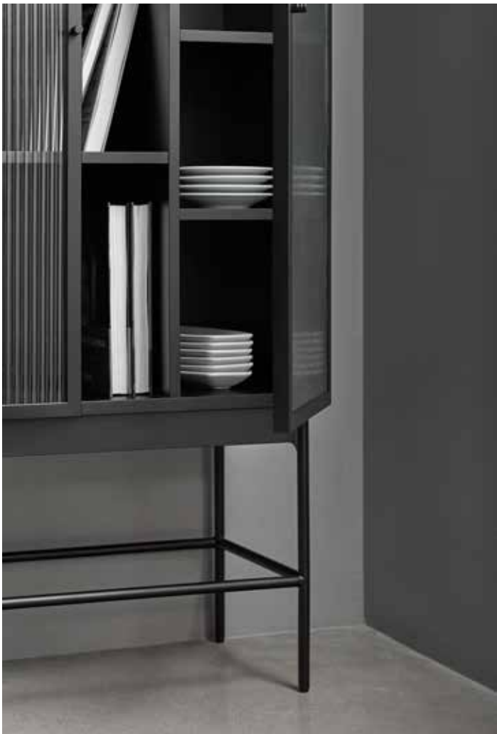
Blur - Auxiliar 2P