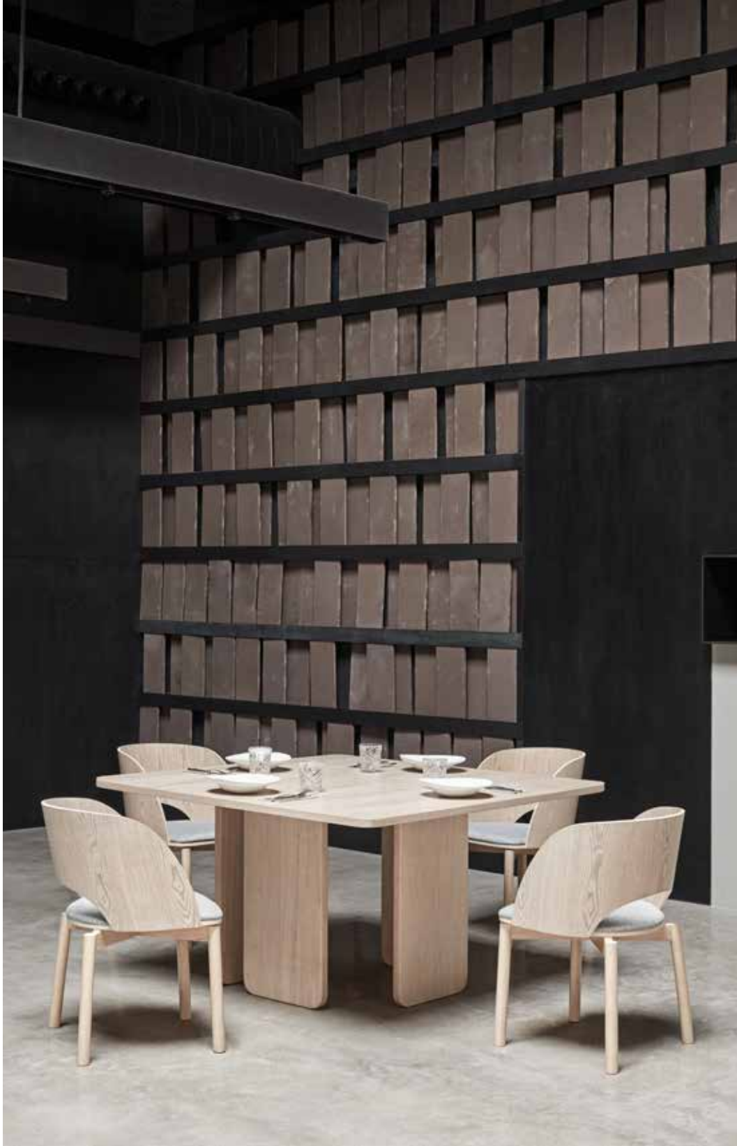
Dining table / Table de séjour