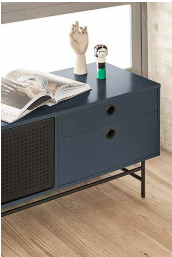
TV bench 2D4Dr / Meuble TV 2P4T