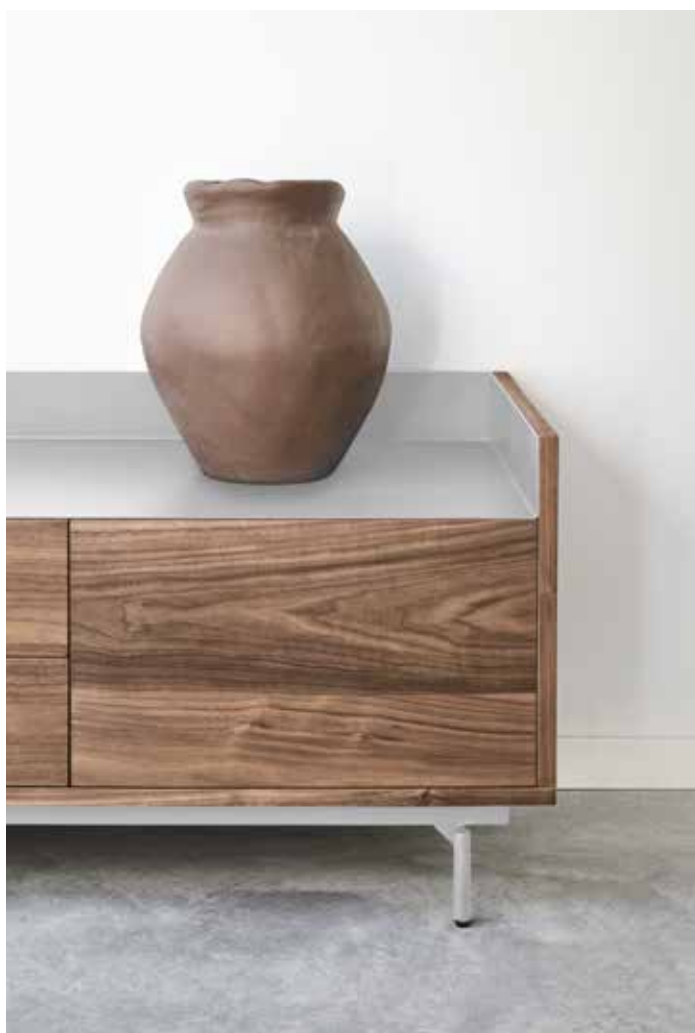
Valley - Mueble TV 3P2C