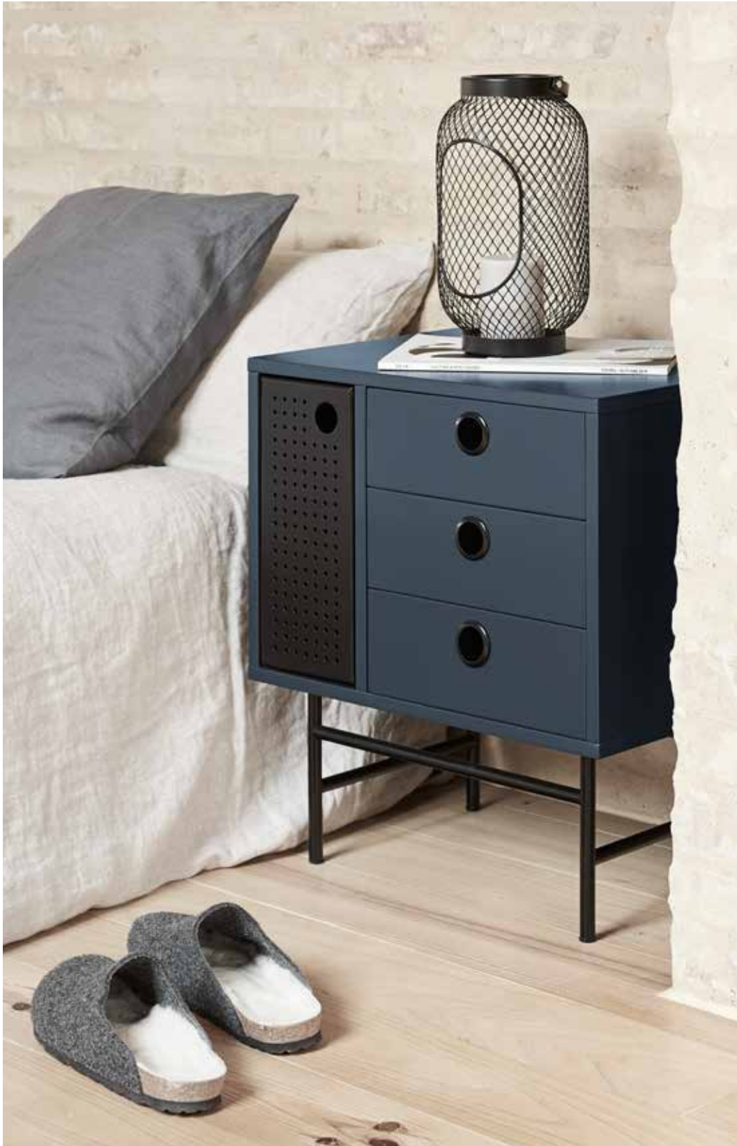
Punto - Mesita 1P3C