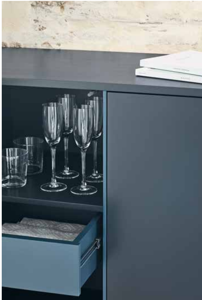
Minima - Auxiliar 2P2C