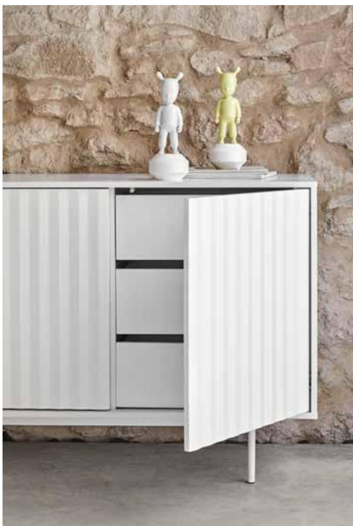
Sierra - Aparador 4P3C