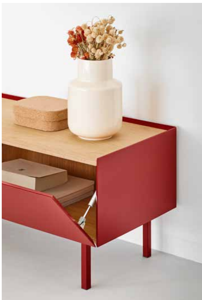
Arista - Mueble TV 1P2C