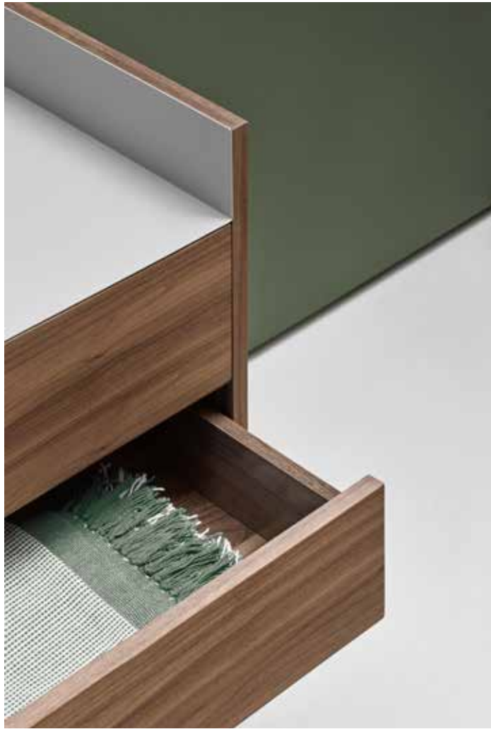
Sideboard 2D3Dr / Buffet 2P3T