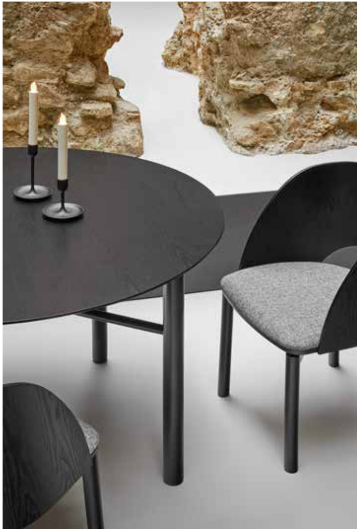
Junco - Mesa de salón