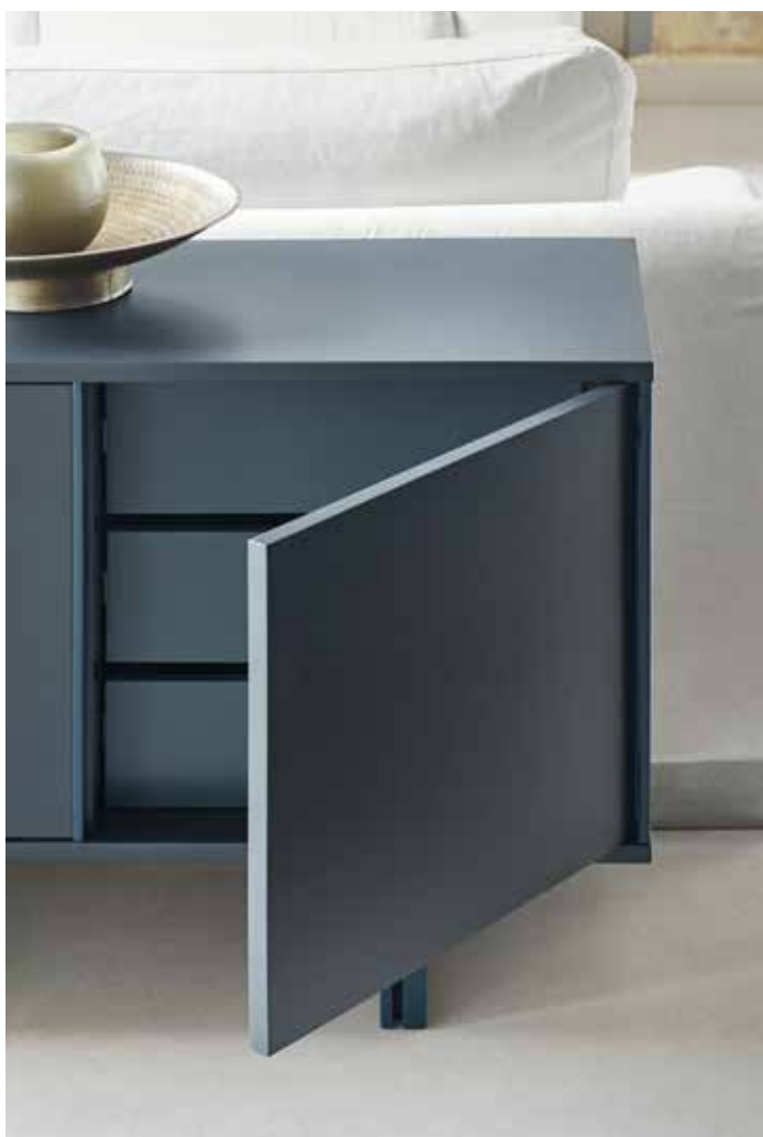
Minima - Aparador 4P3C