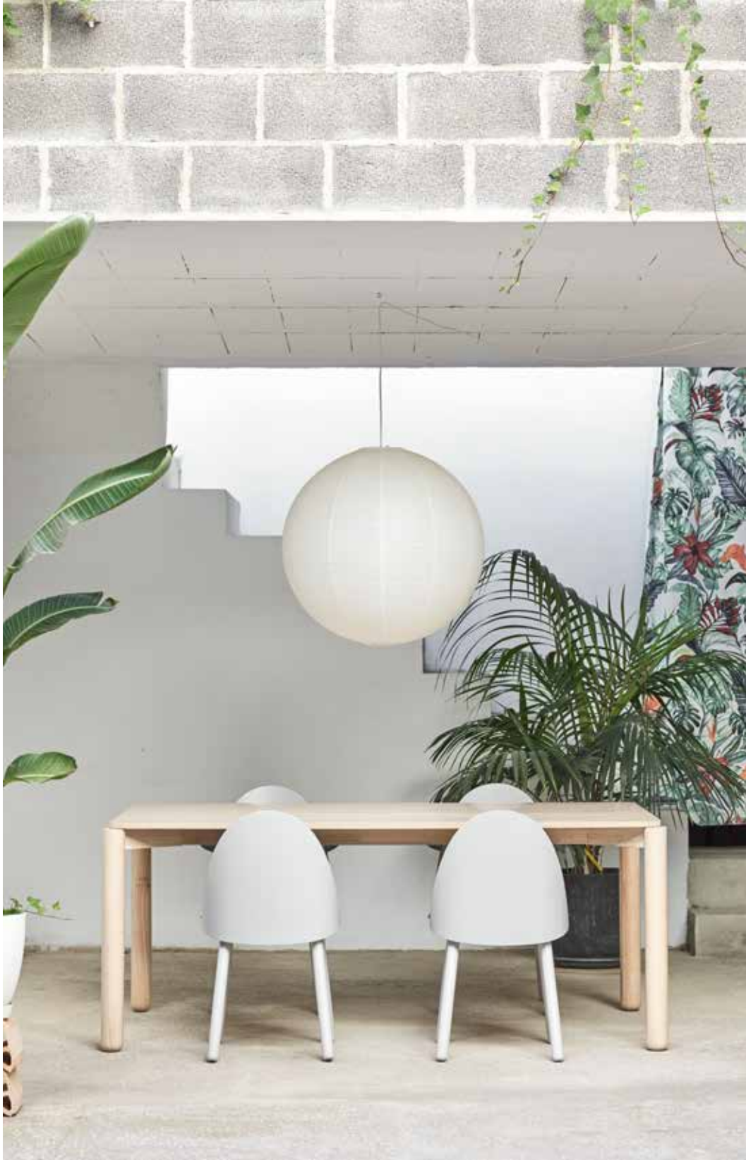
Dining table / Table de séjour