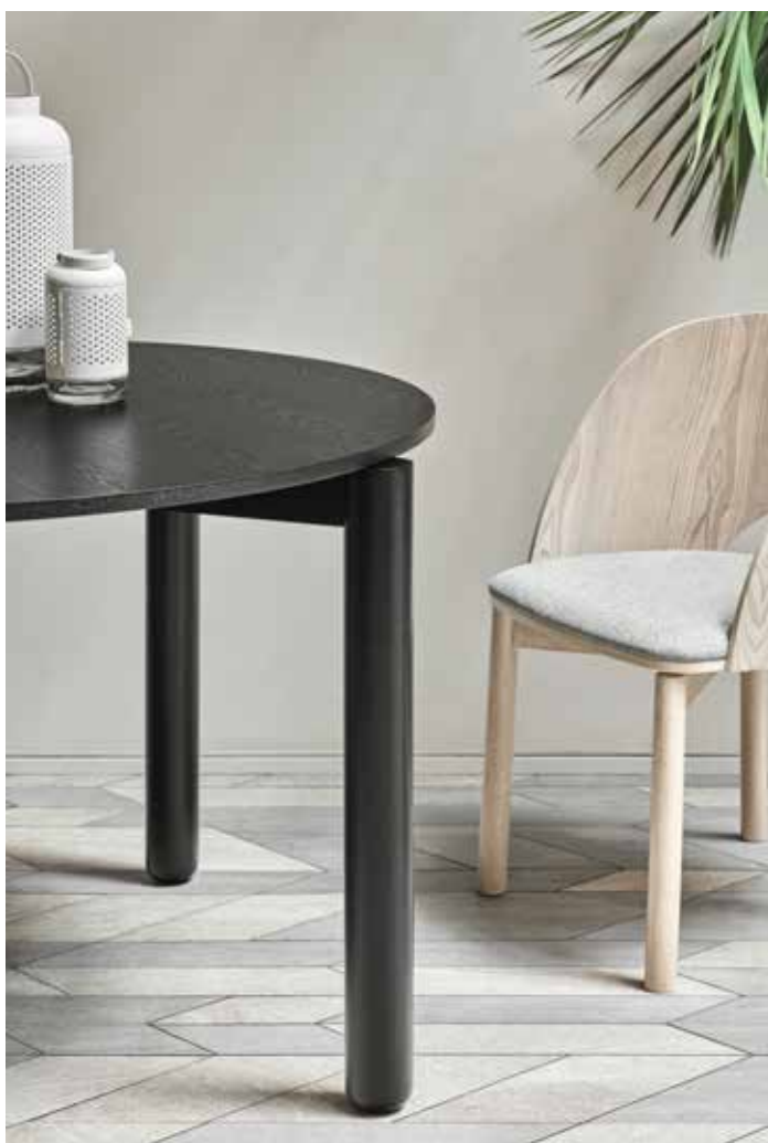
Atlas - Mesa de salón