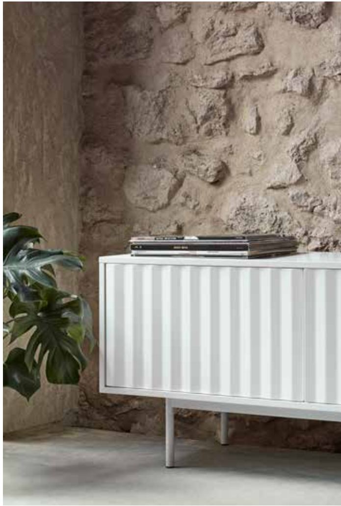
TV bench 3D / Mueble TV 3P