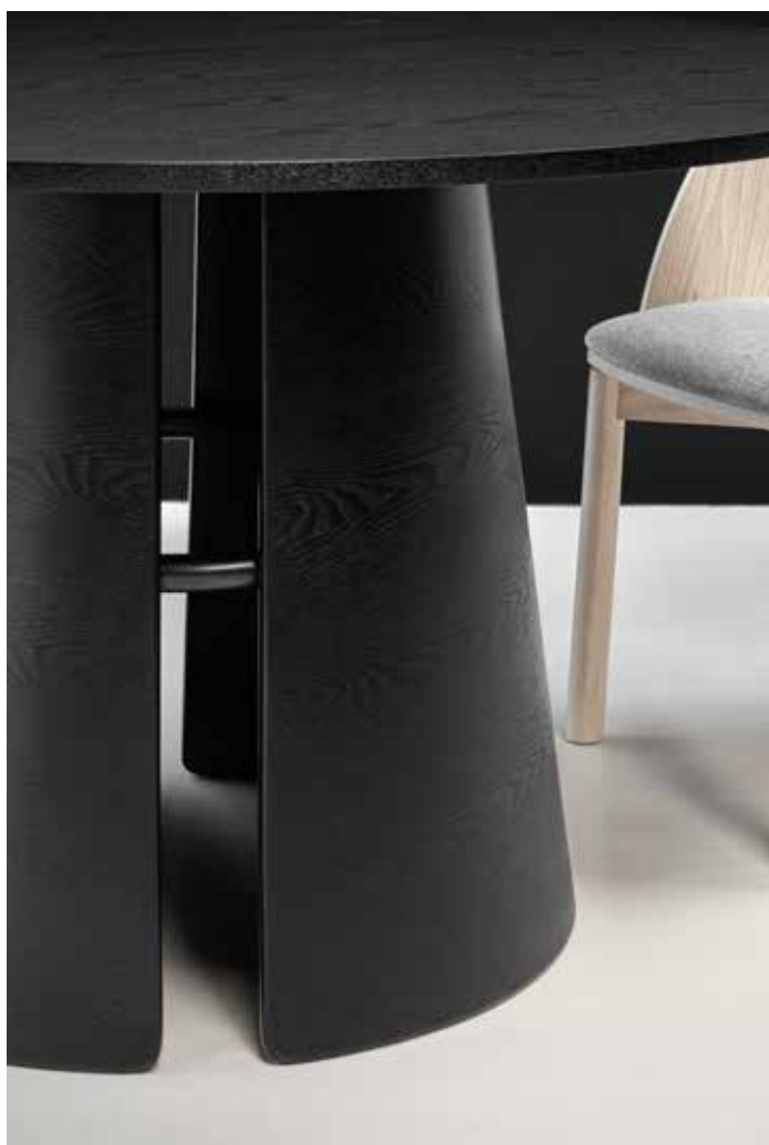
Dining table / Table de séjour