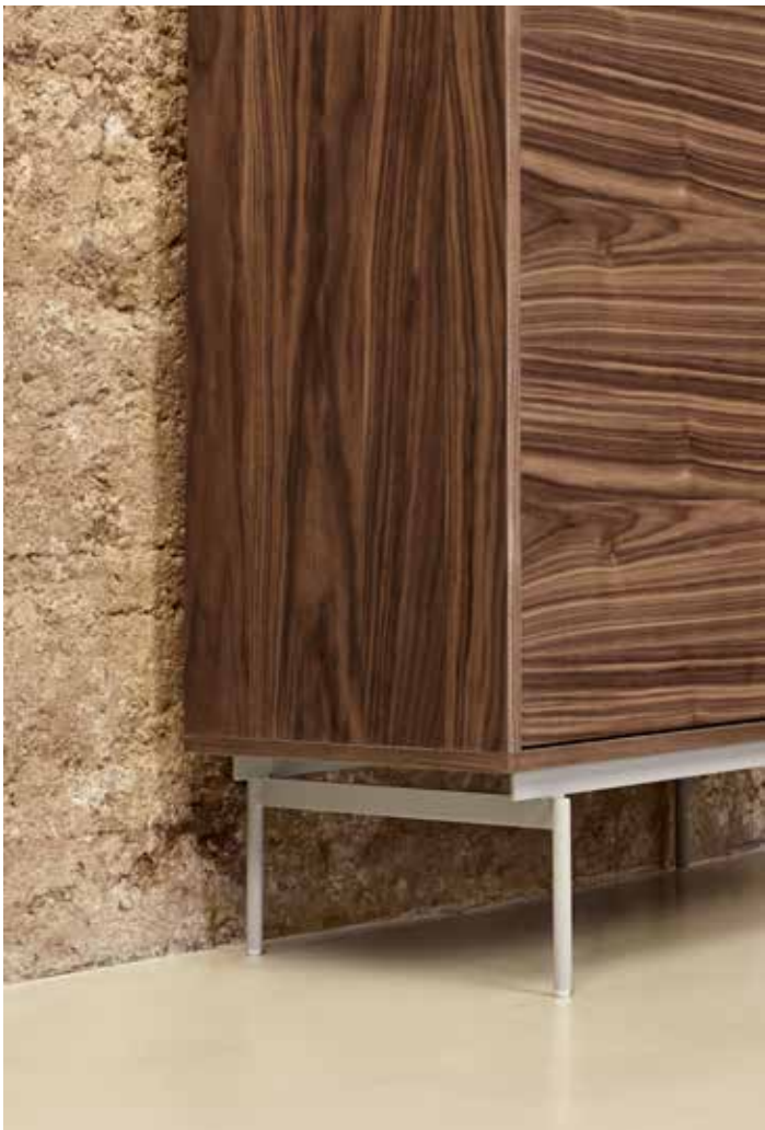
Valley - Auxiliar 2P1C