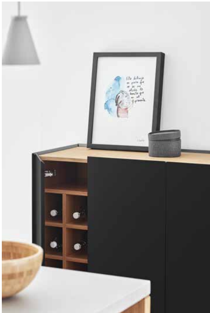
Arista - Auxiliar 3P