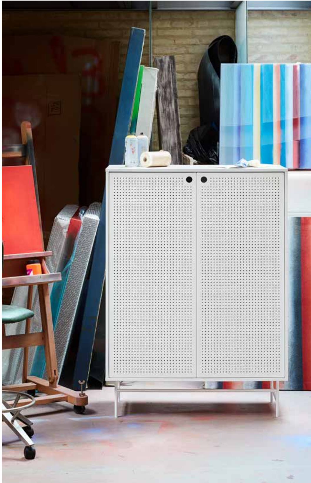
Cabinet 2D4Dr / Meuble auxiliaire 2P4T