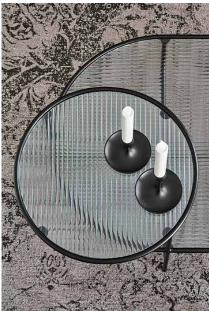
Nix - Mesa de centro