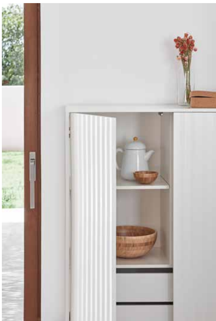
Cabinet 2D2Dr / Meuble auxiliaire 2P2T