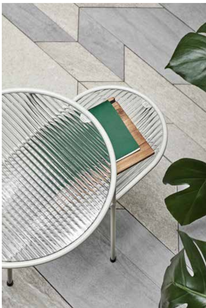
Side table / Table de coin