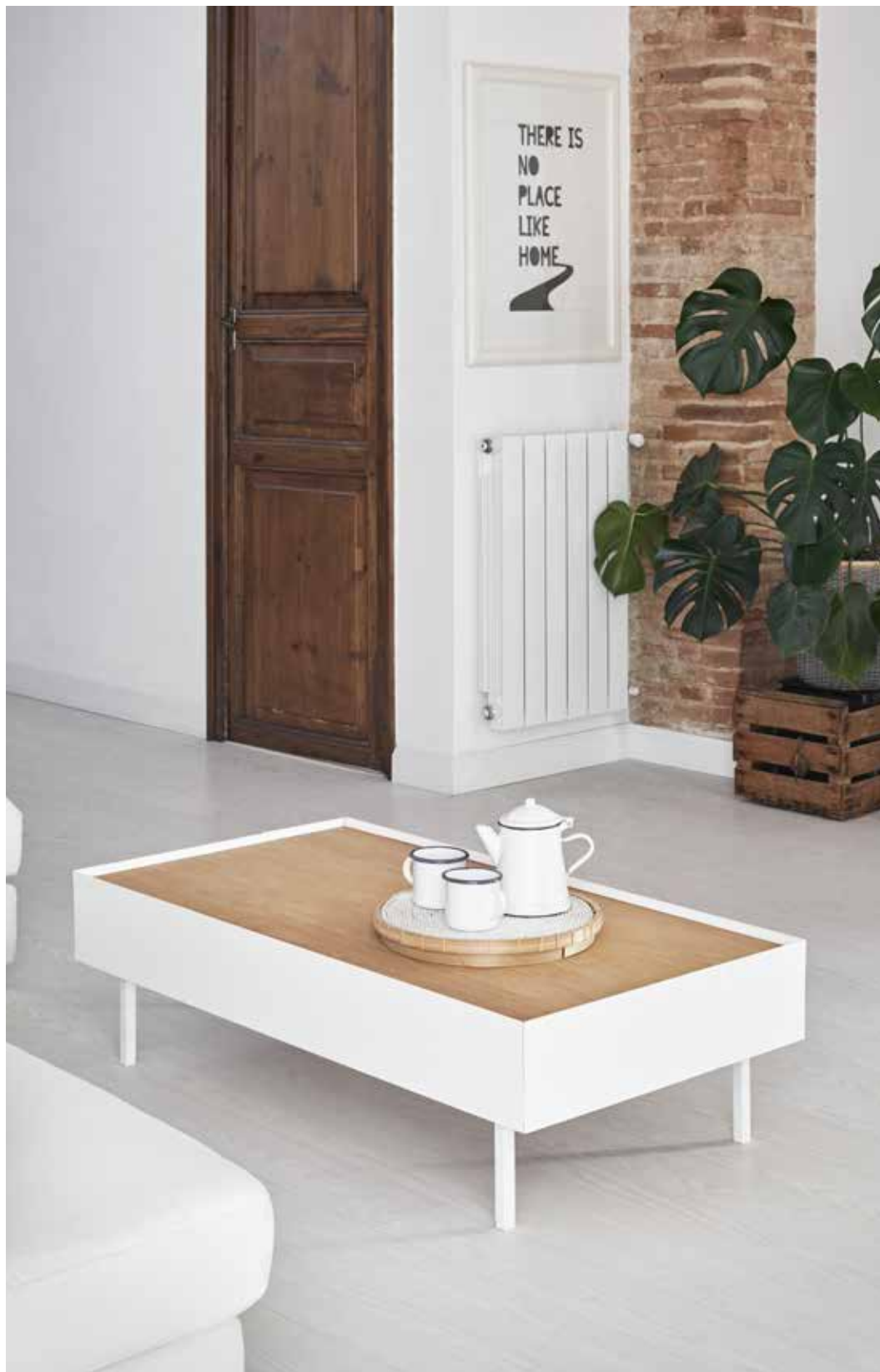
Coffee table 2Dr / Table de salon 2T