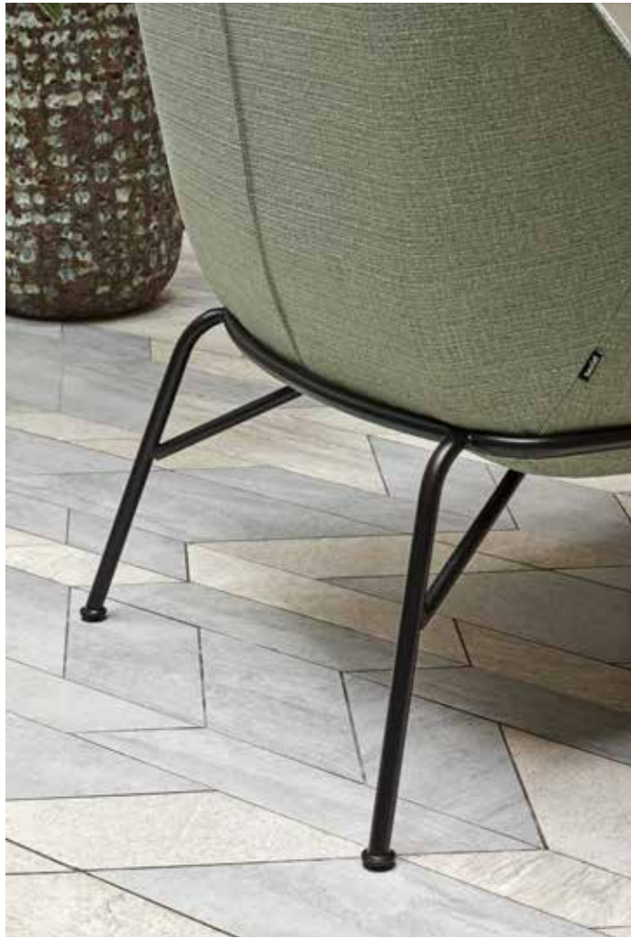
Armchair / Fauteuil