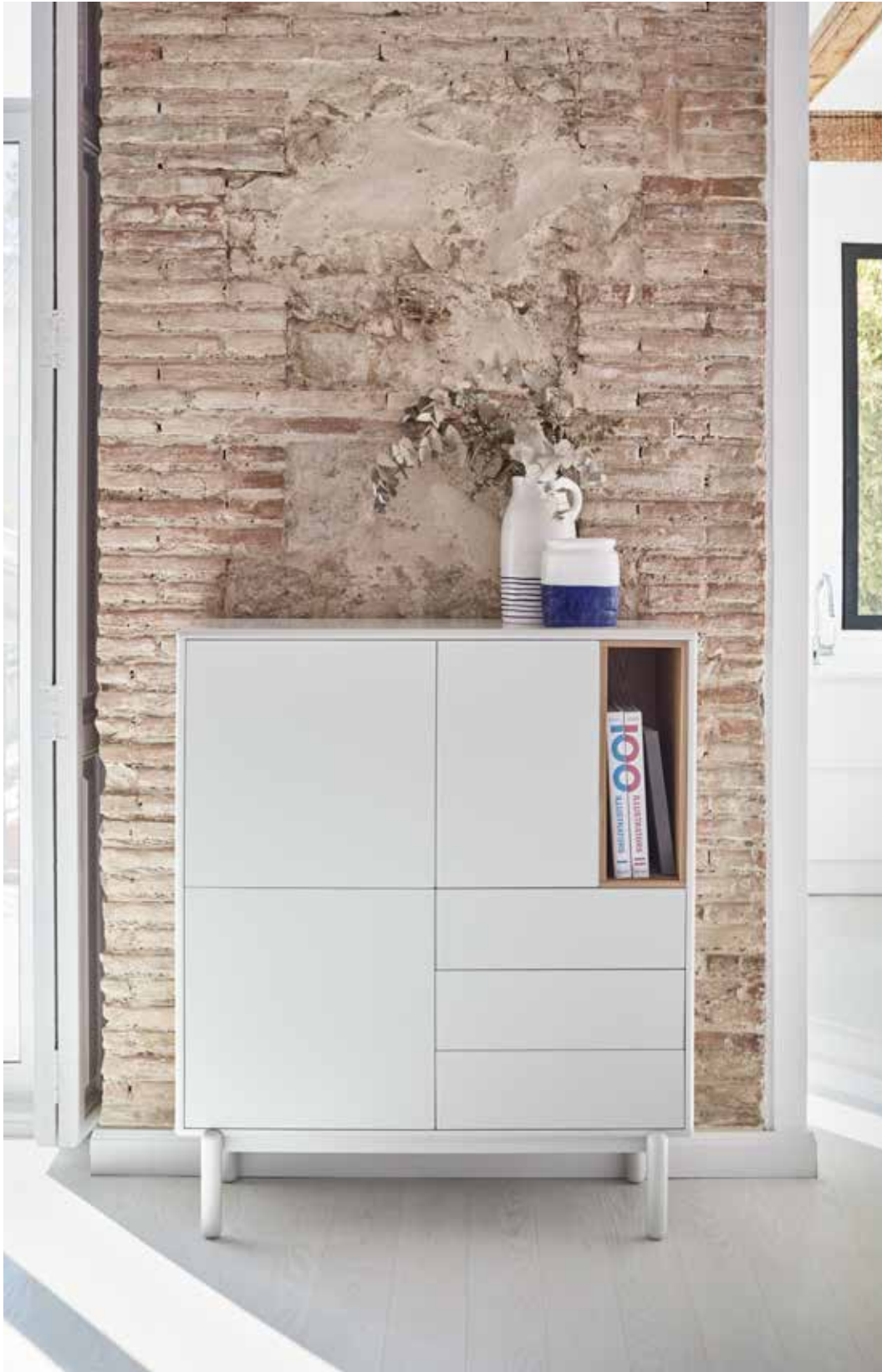
Cabinet 3D3Dr / Meuble auxiliaire 3P3T