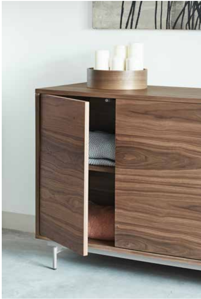
Sideboard 3D3Dr / Buffet 3P3T