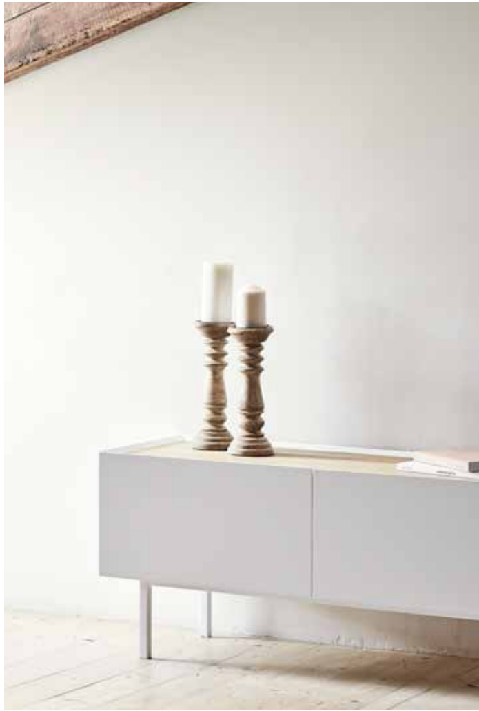
TV bench 1D2Dr / Meuble TV 1P2T