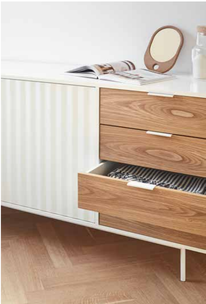
Sierra - Aparador 2P4C