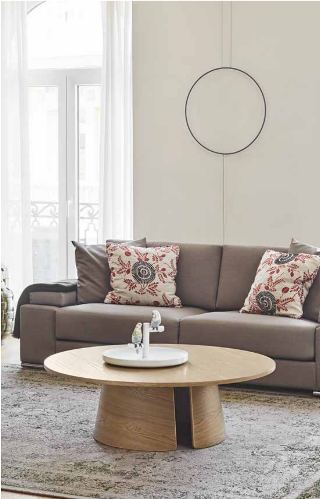
Coffee table / Table de salon