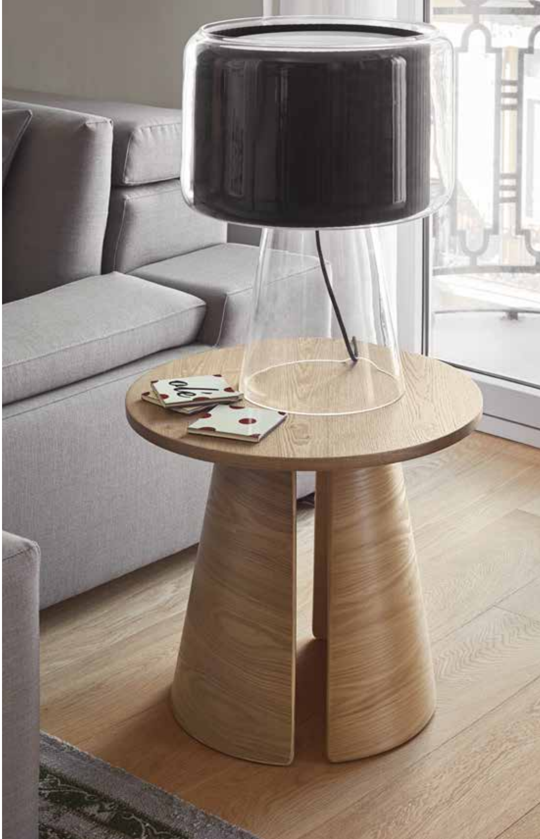
Side table / Table de coin