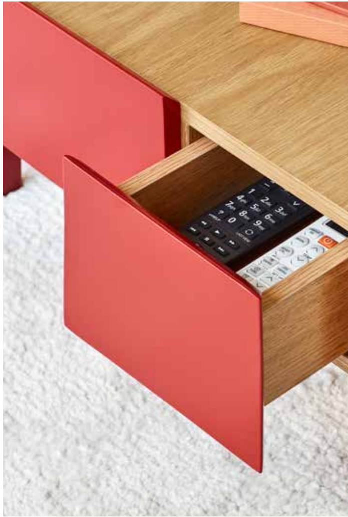
Coffee table 2Dr / Table de salon 2T