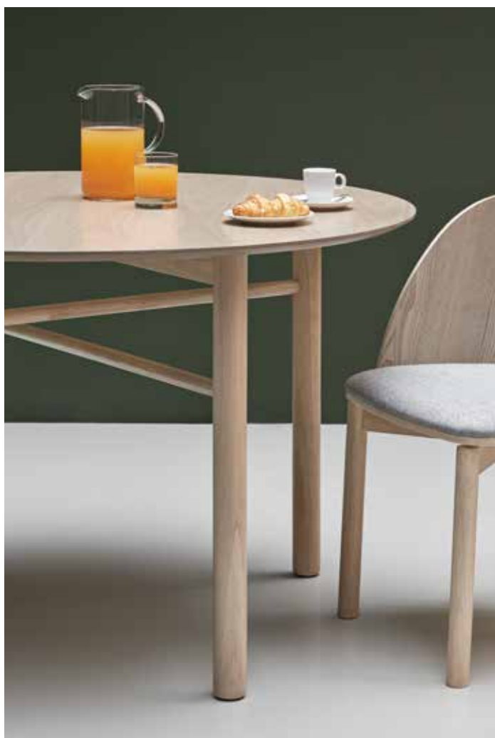
Dining table / Table de séjour