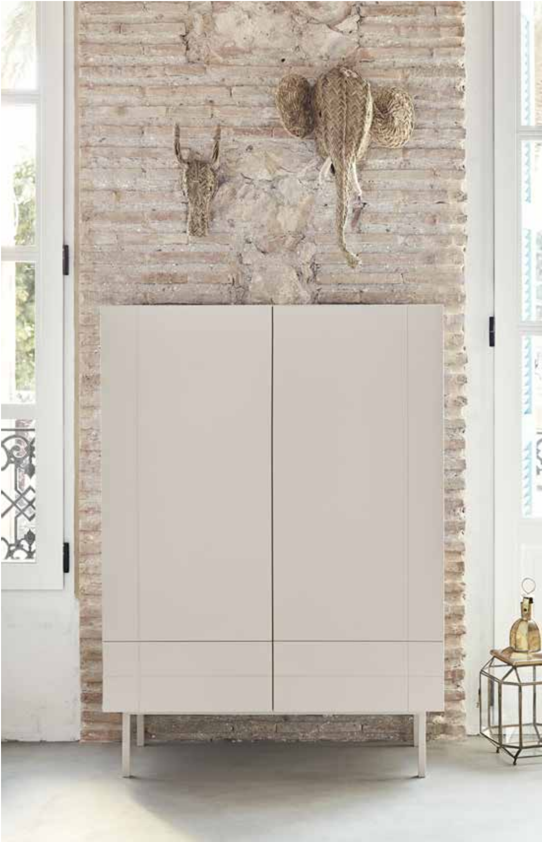
Línea - Auxiliar 2P2C