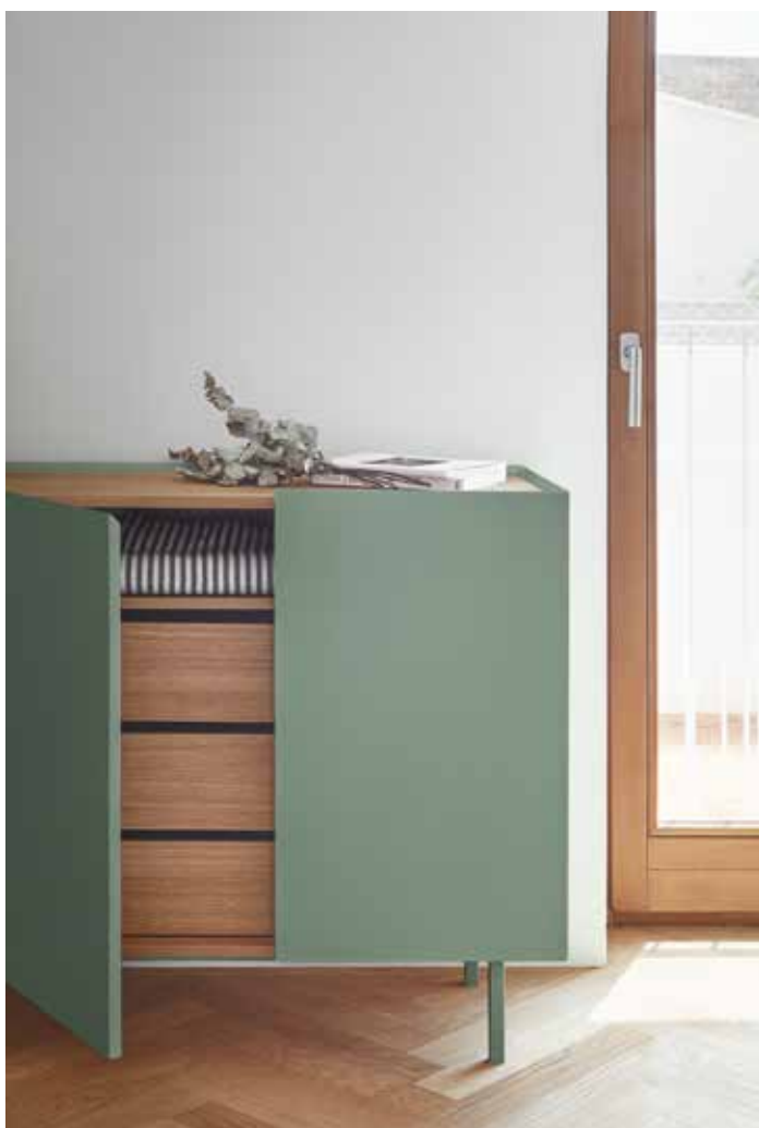
Arista - Aparador 3P3C