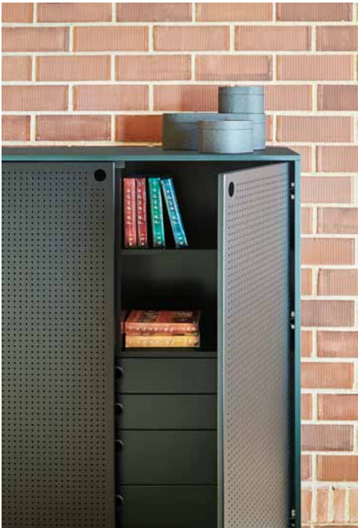
Punto - Auxiliar 2P4C